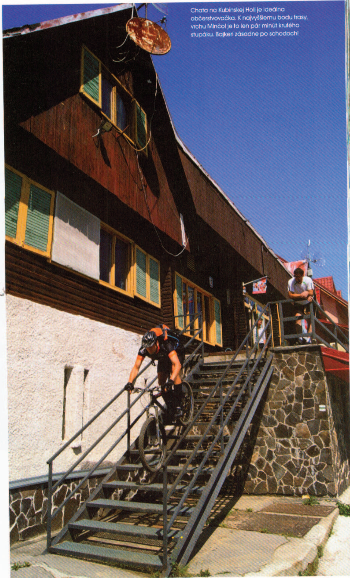
Chata na Kubínskej Holi je ideálna občerstvovačka. K najvyššiemu bodu trasy, vrchu Minčol je to len pár minút krutého stupáku. Bajkeri zásadne po schodoch!