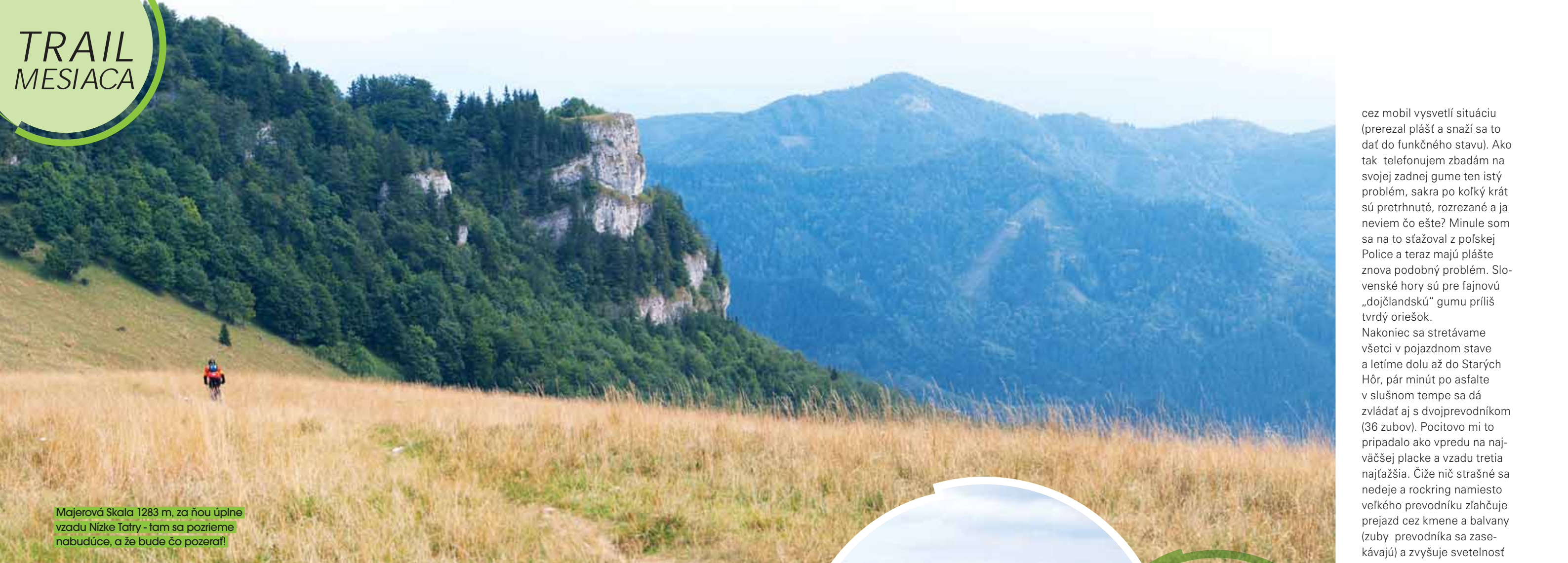
Majerová Skala 1283 m, za ňou úplne vzadu Nízke Tatry - tam sa pozrieme nabadúce, a že bude čo pozerat!