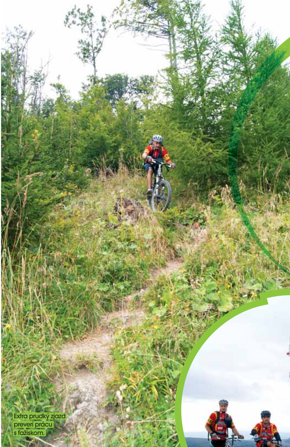
Extra prudký zjazd preverí prácu s ťažiskom.

turisti, by mohli urobiť službu nám a chodiť po chodníku, ako sa sluší i patrí, a svojich štvornohých „čoklov“ si uviazať na vodítko. Aj napriek pár gentlemanským príbrzdiam pre výletníkov, si zjazd užívame plnými dúškami. Jemné zákruty v rýchlosti majú rytmus a nútia presne korigovať smer medzi viacerými stopami. Jedna ma predsa len prekvapí a vyletujem v dlhom drifte von, stačí pustiť brzdy a bajk si našiel cestu späť. Behom chvíle zosadáme pod fotogenickou Majerovou skalou (1283 m). Jedinou nevýhodou je nutnosť preniesť bajk po nezjazdnom úseku cez jej masív.