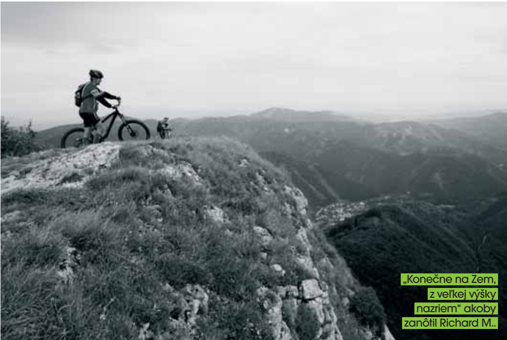
„Konečne na Zemi, z veľkej výšky nazriem“ akoby zanôtil Richard M..

S Paedrom rozoberáme, že tie hrebene v Karpatском oblúku sa na seba podobajú jak vajce vajcu. Či už je to na Ukrajine (Svidovec), či v Srbsku a Bulharsku (Stará planina) alebo v Rumunsku je to rovnaký geologický rukopis. Chytiť tu v letných horúčavách búрку, znamená nedobrovoľne vyhrať konkurz na hromozvod. Nám sa troška mračí, ale potvrdzuje sa staré známe „z toho mráčka nezaprší“. Kopce ešte nepovedali posledné slovo a na pohľad relatívne málo zvlnený profil preverí niekoľkými prudkými výšvihmi, najkvalitnejší je isto na kopec Frčkov. Za ním to je na Ostredok (1592 m) pár minútiek krásnym singlovým traversom s pohodovým sklonom. Aj keď nehádže pod kolesá žiadne prekážky, Paedr ekvilibristicky preletuje rajdy pri frajerení pred mojím objektívom. Rehocem