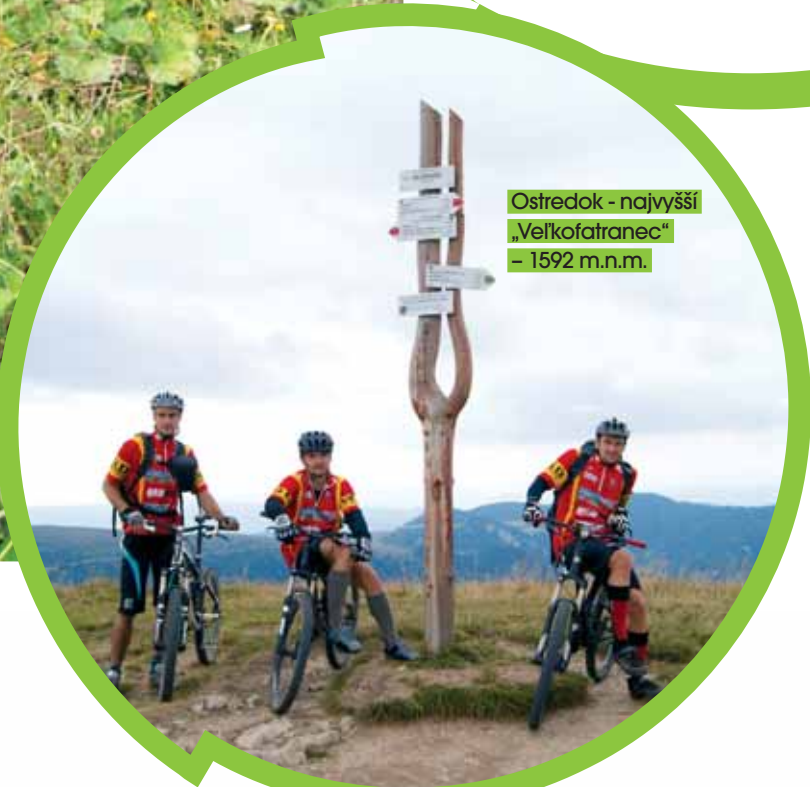
Ostredok - najvyšší „Veľkofatranec“ - 1592 m.n.m.

Modrá značka pokračuje do dediny Staré Hory a to je presne náš smer. Po Majerovu skalú to bolo „hardtail friendly“ teraz sa sklon podstatne zlomí a nasledujú niektoré freeride pasáže. Maratónci a XC jazdci radšej volia žltú značku cez zjazdovku ešte zo spomínanej Líšky. Na topomape sú vrstevnice nalepené na sebe jak naivné štyridsiatničky v prvom rade na koncerte Michala Davida. Singel sa krúti v prudkých točkách a niekedy sa zdá, že sa tam ani nedá vopchať, ale stačí dať zadok za sedlo a nejako to pomaličky spustiť dole. Okrem jedného neriešiteľného úseku je to zábava a atakovanie vlastnej guráže. Aj tá najmenšia chyba je potrestaná preletom. Mňa