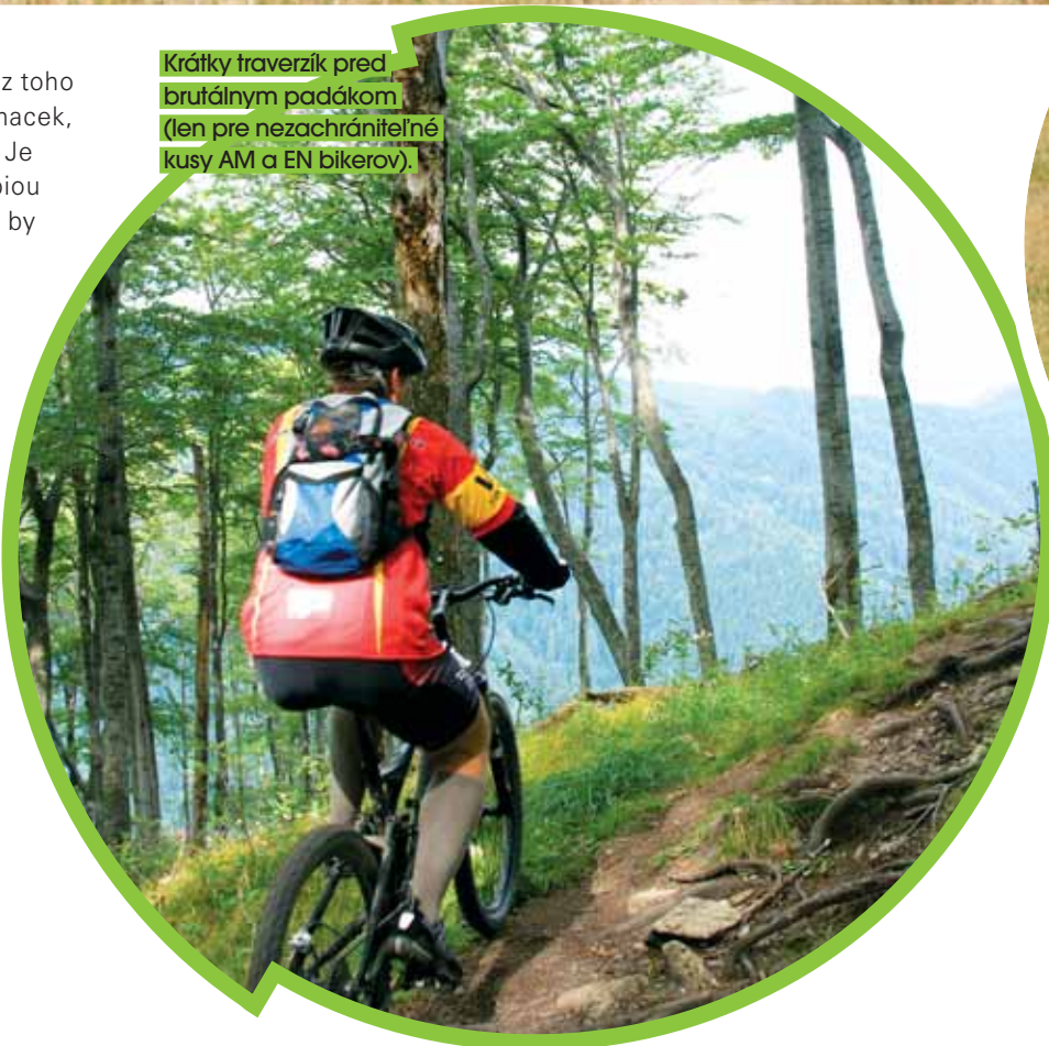
Krátky traverzík pred brutálnym padákom (len pre nezachrániteľné kusy AM a EN bikerov).

PÁDY PATRIA K ŤAŽKÉMU TERÉNU, O TOM NIE JE POCHÝB, TAK AKO K NÁRODNÉMU PARKU POPADANÉ STROMY.