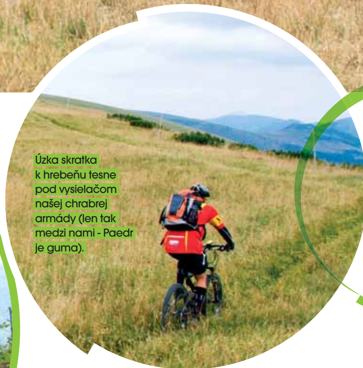
Úzka skratka k hrebeňu tesne pod vysielačom našej chrabrej armády (len tak medzi nami - Paedr je guma).

ako sa to deje v zahraničí (česť výnimkám, ktoré existujú aj u nás). Tento perfektný a dlhý singel by ti to zaslúžil. Ako stráca nadmorskú výšku, znižuje sa aj technická obtiažnosť a zvyšuje rýchlosť. Opäť nechýba ukázkový flow, až po zväžnicu na ktorú