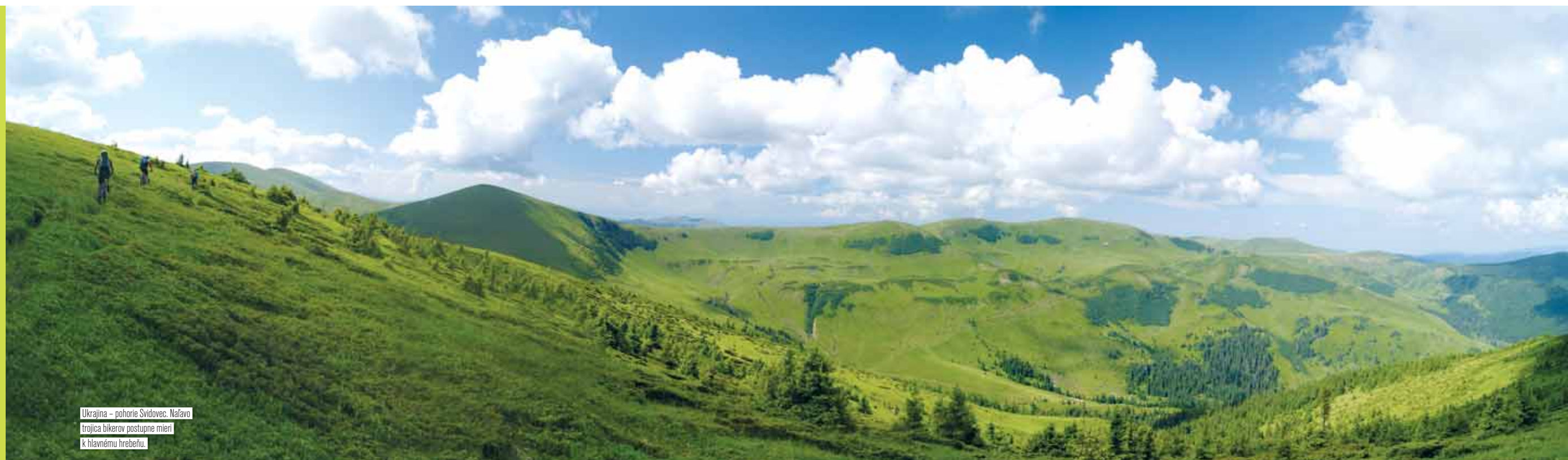
Ukrajina – pohorie Svidovec. Naľavo trojica bikerov postupne mieri k hlavnému hrebeňu.