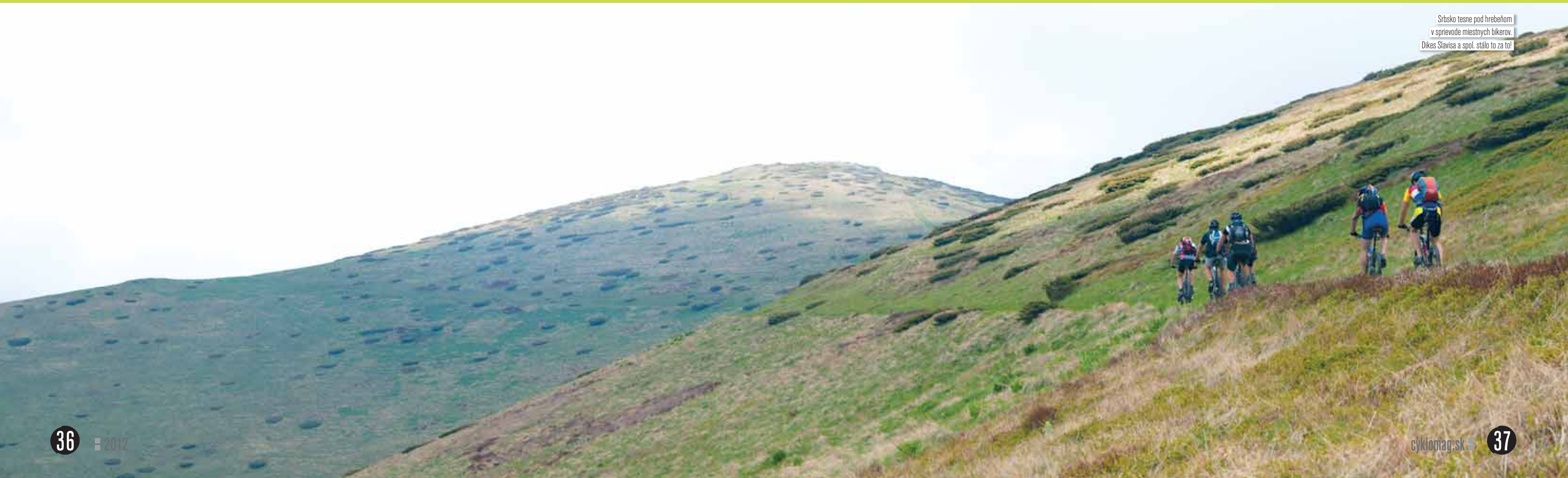
Srbsko tesne pod hrebeňom v sprievode miestnych bikerov. Dikes Slavisa a spol. stálo to za to!