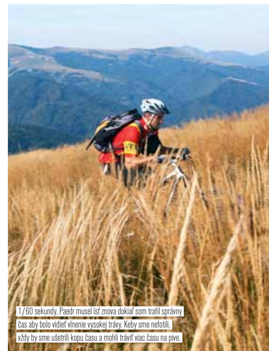
1/60 sekundy. Paedr musel ísť znova dokiaľ som trafil správny čas aby bolo vidieť vlnenie vysokej trávy. Keby sme nefotili, vždy by sme ušetrili kopu času a mohli tráviť viac času na pivo.

– obťažnosťou však určite. Pozor, dnes ešte zjazd nepovedal posledné slovo. Zo sedla je viacero možností a smerov, ktorými sa dá stratiť nabratá výška.