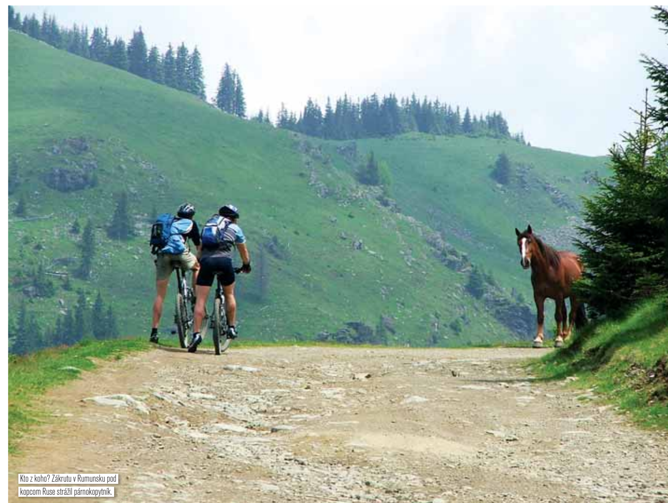
Kto z koho? Zákrutu v Rumunsku pod kopcom Ruse stráží párnokopytník.

Či do skupiny patrí aj Srbsko- Bulharské pohorie Stará Planina netuším. Možno je to z geografického hľadiska už nejaký iný horský celok, ale