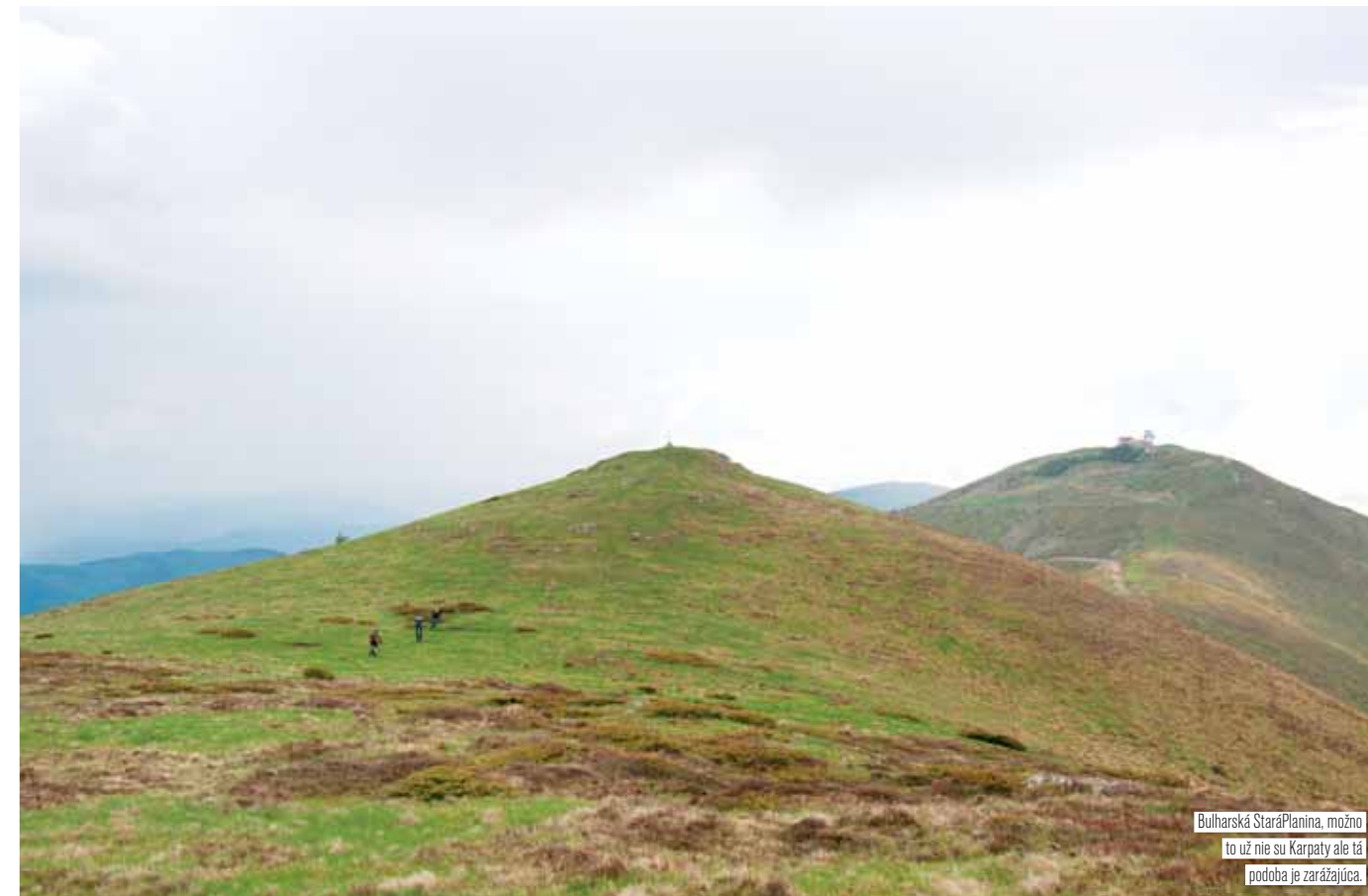
Bulharská StaráPlanina, možno to už nie su Karpaty ale tá podoba je zarážajúca.

tá podoba! Nadmorskou výškou je to na Tatry, no nami navštívená západná časť bola taká jemne vyššia Lúčianska Malá Fatra. Týpci zo Srbska, ktorých sme úplnou náhodou stretli v Dimitrovgrade nás previedli fantastickou panoramatickou hrebeňovkou. Bohom zabudnutá časť Srbska s horskými osadami v dolinách, ktoré v zime nie sú prístupné autom, no v malých počtoch starších ľudí obývané celoročne! Z Bulharskej strany hraníc dominuje vrch Kom, jemne prevyšujúci dvojtisícovú hranicu. Terén a reliéf v podstate tá istá pesnička. Výrazný zvlnený hrebeň a široké vrcholové holiny. Množstvo zrážok zapadá do mozaiky. My sme tam mokli každú jazdu. Až teraz si uvedomujem že v máji a júny je spojovacím prvkom počasie. Tak ako v našich končinách aj v ostatných častiach Karpatského oblúka v tomto období vládne výrazná zrážková činnosť. Aby to nestačilo, pridávajú sa k tomu rýchle búrky, prichádzajúce z ničoho nič. V každom prípade si Karpaty a ich hlboké doliny zachovávajú stále ráz divočiny, hlavne východne od Slovenska. Nedosahujú ani zďaleka výšin Álp, no outdoorovým bajkovým zážitkom smelo konkurujú. K tomu pridávajú hodnotu množstva MTB neobjavených trialov, a pocit úplného odlúčenia od civilizovaného sveta. Kto je teda zvyknutý na skromné podmienky (nemyslím tým zájazdy cez cestovnú agentúru s mechanikom a vyvázaním batohov) a má zmáknuté Fatranské hrebeňovky môže smelo vyraziť aj do relatívne blízkych destinácií. Určite neofutujete! Stretáme sa v Karpatoch. Vidíme sa v teréne! ✖