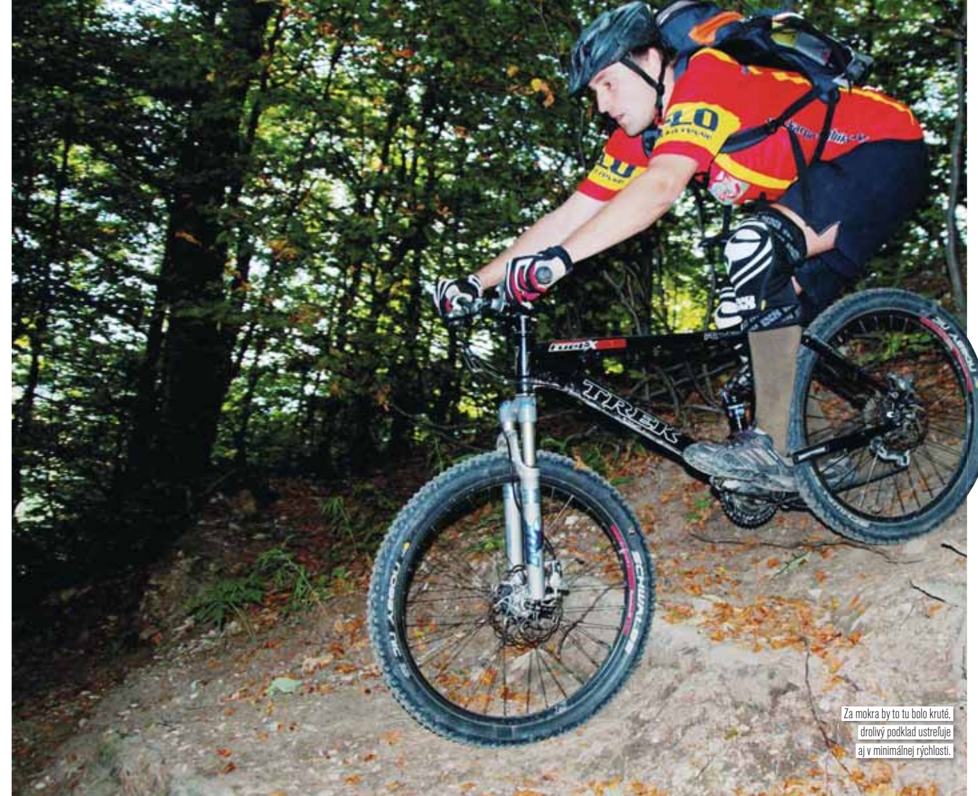
Za mokra by to tu bolo kruté, drolivý podklad ustreľuje aj v minimálnej rýchlosti.

Posledné metre sa nám nepodarili zdolať a zase kúsok potlačíme. Kozí chrbát je otázkou pár metrov – z vrcholku v 1330 metroch pokračuje kamenistý singláč do Hiadeľského sedla. Rýchlo nahadzujem kolenačky. Sprvu je to taká rytmická tancovačka v strednej rýchlosti. Chodník sa dá jednoducho čítať lebo je vychodený vo vysokej tráve až pokiaľ sa nezačne lámať chleba. Sklon sa stupňuje po hranicu maximálneho prudasu, na ktorom sa dokážu široké gummy ako – tak udržať. Podklad je jemne drolivý. O nejakých maximáľkach sa nedá hovoriť. Utiatnuté točky v úzkom slede nadväzujú na ešte ťažšiu časť plnú koreňov a šikmých schodíkov vyrobených z guľatých brvien. Za mokra by som tu nešiel ani na pešo. Teraz je úplne sucho a tak so šťastím schádzam komplet okrem jedného ťažkého zoskoku (najväčší borci a Chuck Norris by to mohli dať). Teraz by som z radostou menil Trailbike za Enduro. Paedrovi to na jeho 2,3 palcových Nevegaloch ustreľuje o trochu viac a dosť sa vytrápi aj na biku s poctivými zdvihmi. Zošup do Hiadeľského sedla (1099 m) netrval dlho a ani sa dĺžkou nedá zrovnáť z predchádzajúcimi trailami