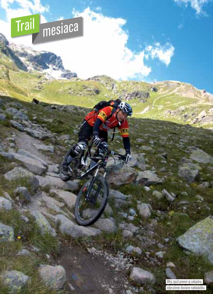
Dlhý zjazd preverí aj celopéra, odpruženie dostane nakladačku.