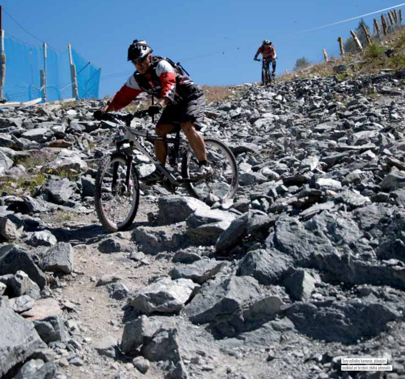
Tony voľného kameňa, plávajúci podklad pri brzdení zdvíha adrenalin.

Preklínam nemecký eshop. Vyklepaný zastavujem a fotím. Paedr začína ukazovať chrbát a oproti nám jazdí inú ligu. Keď som sa ho pýtal, či sa nebál, že sa strtká dvesto metrov dole do vodopádu, odpovedal: „šak tam je tráva...“ Pozrite fotky a zhodnoťte sami. Singlový trail po strmom úbočí je ako vystrihnutý z pohľadnice. Stokrát lepší ako trail po zjazdovke. Na štyroch miestach zosadáme, okrem Paedra. Ten všetko dal, aj keď s dotykom nohy. Na drevenom premostení hádžem Tarzana a sťa opičí muž visím na drevenom zábradlí, našťastie zvnútra. Zachytil som rajdy o konštrukciu a okamžite sa porúčam k zemi. Rameno bolí