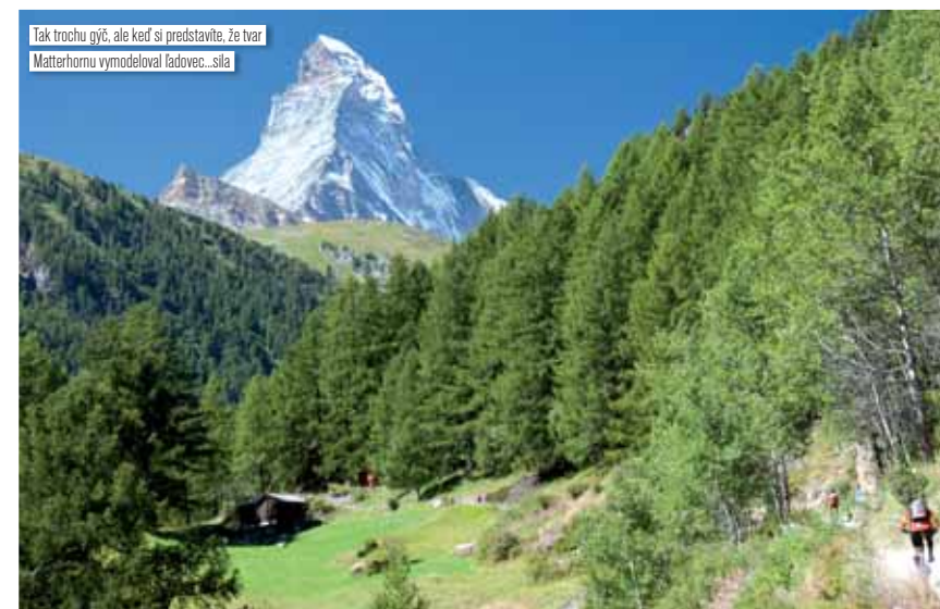
Tak trochu gýč, ale keď si predstavíte, že tvar Matterhornu vymodeloval ľadovec... sila

dodnes. Keď som zočil, že kde som mohol plachtiť, ani doktor Mengele by sa vo mne krvi nedorezal. Od tejto chvíle idem ešte opatrnejšie, napriek tomu sekám dušu. Bajk sa zdá byť akosi tvrdý, no prikladám to únave a pokročilej dehydratácii.