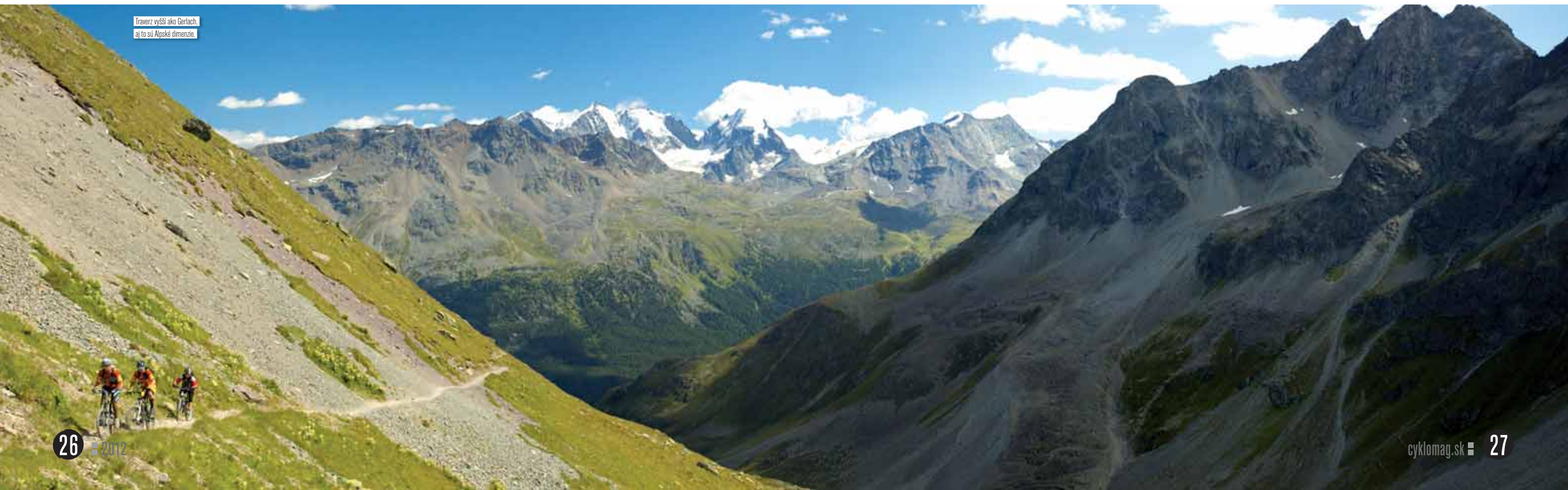
Traverz vyšší ako Gerlach, aj to sú Alpské dimenzie.