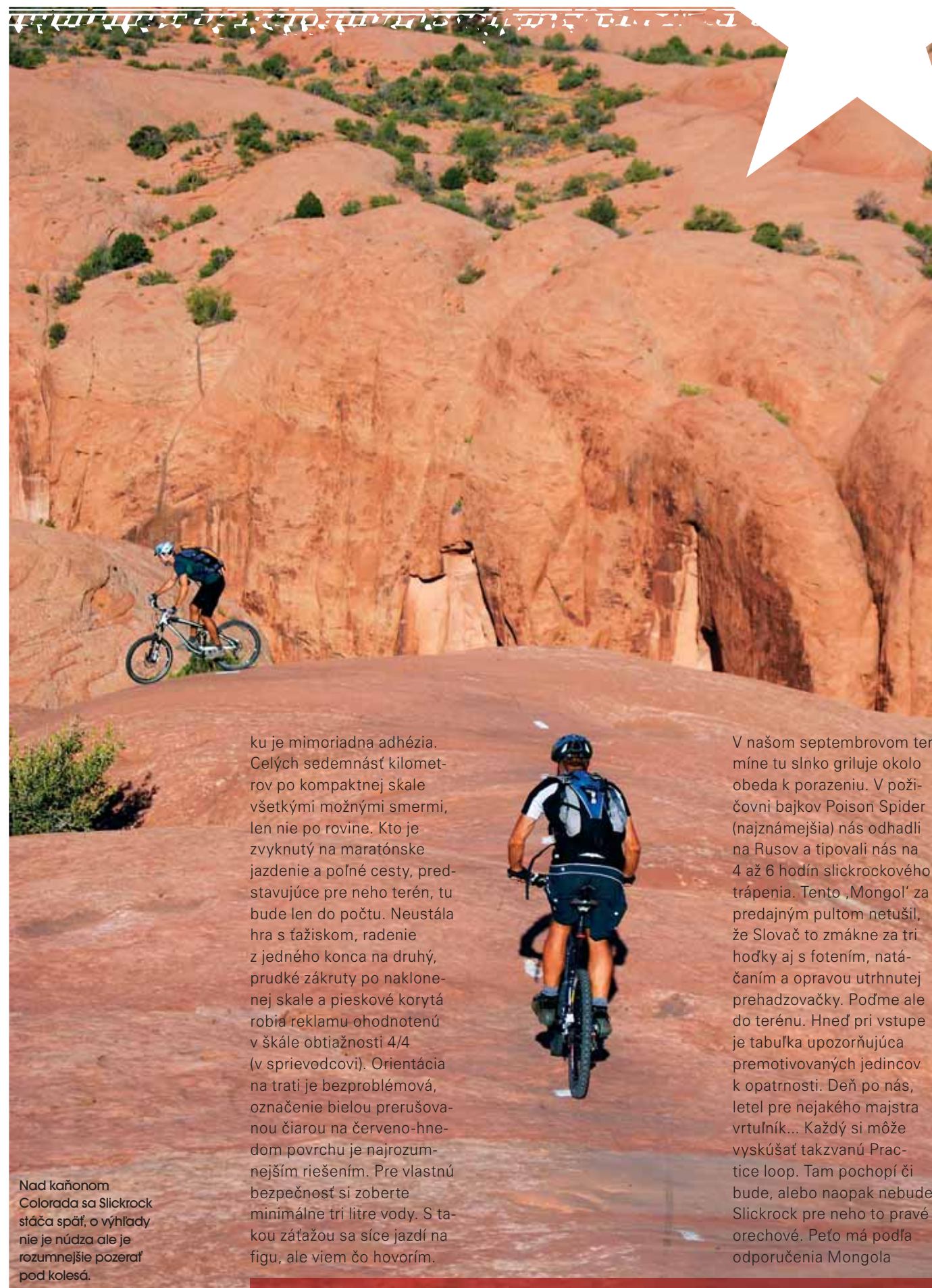
Nad kaňonom Colorado sa Slickrock stáča späť, o výhľady nie je nuda ale je rozumnejšie pozerať pod kolesá.

ku je mimoriadna adhézia. Celých sedemnást kilometrov po kompaktnej skale všetkými možnými smermi, len nie po rovine. Kto je zvyknutý na maratónske jazdenie a poľné cesty, predstavujúce pre neho terén, tu bude len do počtu. Neustála hra s ťažiskom, radenie z jedného konca na druhý, prudké zákruty po naklonej skale a pieskové korytá robia reklamu ohodnotenú v škále obtiažnosti 4/4 (v sprievodcovi). Orientácia na trati je bezproblémová, označenie bielou prerušovanou čiarou na červeno-hnedom povrchu je najrozumnejším riešením. Pre vlastnú bezpečnosť si zoberte minimálne tri litre vody. S takou záťažou sa síce jazdí na figu, ale viem čo hovorím.