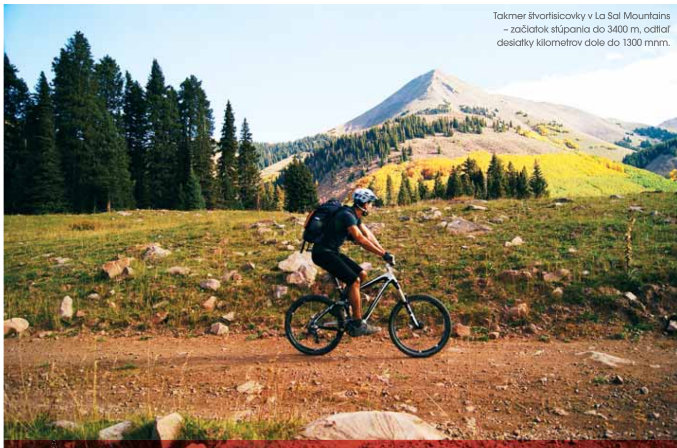
Takmer štvrtisícovky v La Sal Mountains – začiatok stúpania do 3400 m, odtiaľ desiatky kilometrov dole do 1300 mnm.