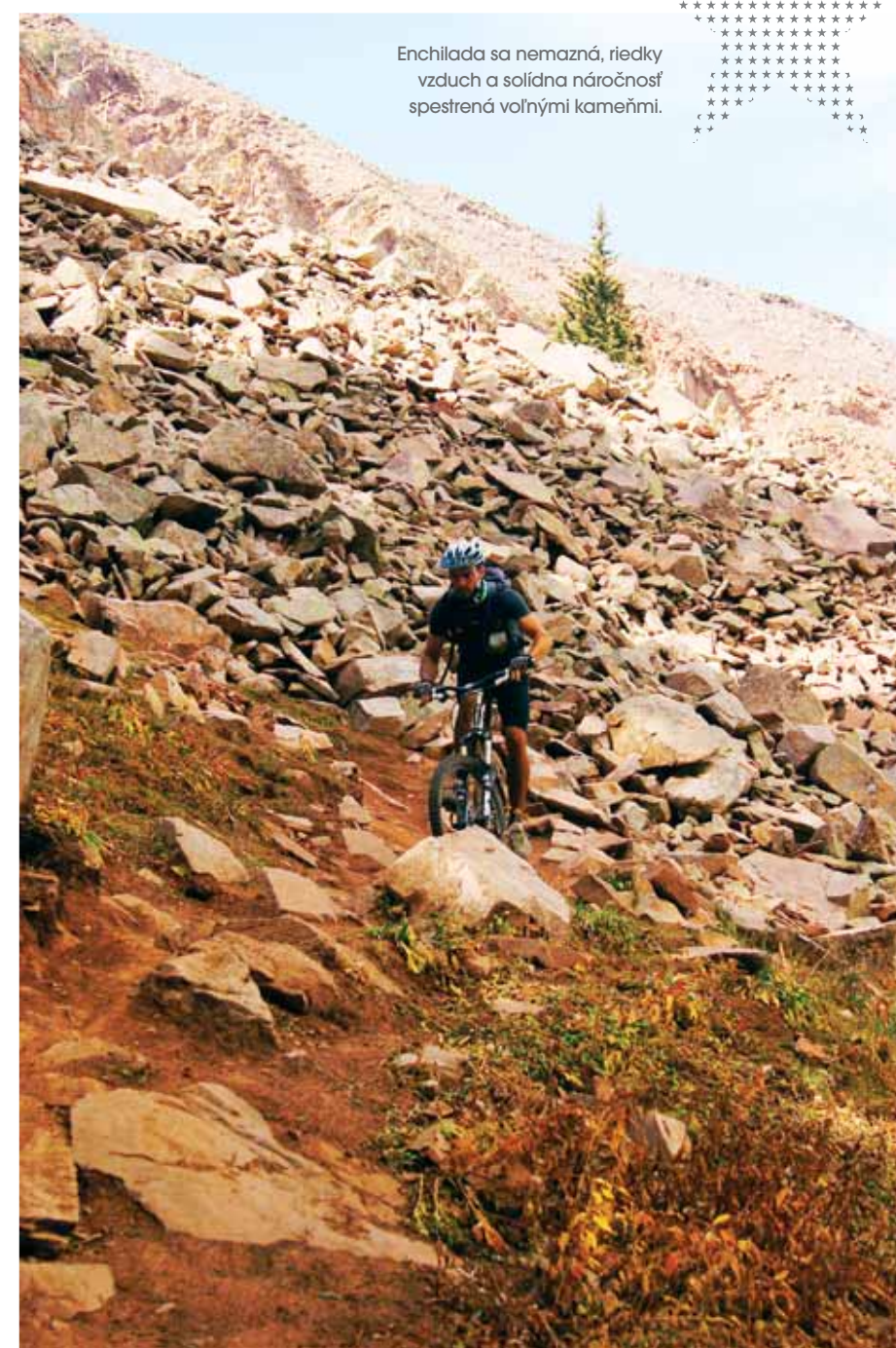
Castle Valley, neskutočná výhliadka z vrchnej časti diokobrazovej rímsy nás posadila na zadok.

Enchilada sa nemazná, riedky vzduch a solídna náročnosť spretená voľnými kameňmi.