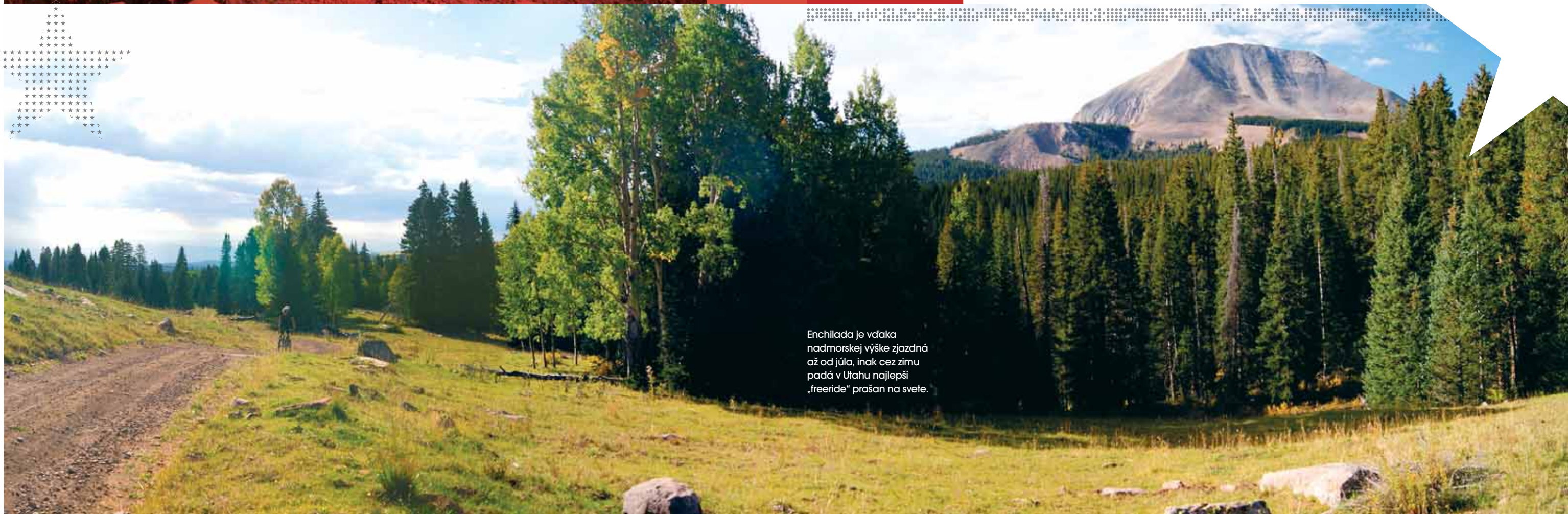
Enchilada je vďaka nadmorskej výške zjazdná až od júla, inak cez zimu padá v Utahu najlepší „freeride“ prašan na svete.