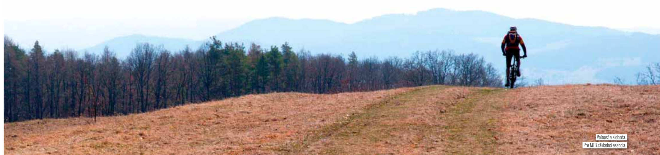
Voľnosť a sloboda. Pre MTB základná esencia.

Do sedla Krížna je to už bezproblémová brnkačka. Odtiaľ sa napojíme na traverz okolo samotného Sitna. Je to vlastne lesácka štrkovica zo severnej strany. Ani sa moc nečudujeme, keď sa zabárame v snehu. Žltознаčený traverz je v podstate niekoľko kilometrov bez prevýšenia a zväžnica sa kľukatí podľa reliéfu hory. Nebyť snehu, je to úsek, ku ktorému by sa nedalo ani nič napísať, také normálne. Podstatné je to, aby sme smerovali k Vlčím jamám, kde definitívne začne stúpanie k Sitňanskému hradu. A že je to poriadny sklon, asi nemusíme hovoriť. Komplikácie so snehom pokračujú na krátkych úsekoch, je sranda ako bajk odstaviť zopár centákov bielej brečky. Keď kúsok prenášam, z mokrého snehu mám okamžite povodeň v tretrách... Z asfaltky stačí poslúchnuť smerovník a v krátkom okamihu ste na hrade (či skôr na zrúcanine).