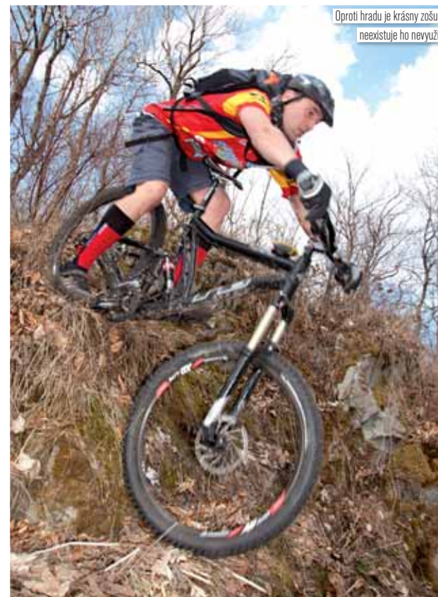
Oproti hradu je krásny zošup, neexistuje ho nevyužiť!