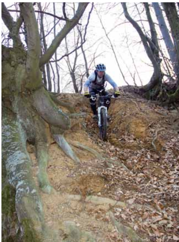
Vidíte ako lineárne pracuje pružinová vidla? Takto vzduch nikdy nestlačíte len pod vlastnou hmotnosťou.