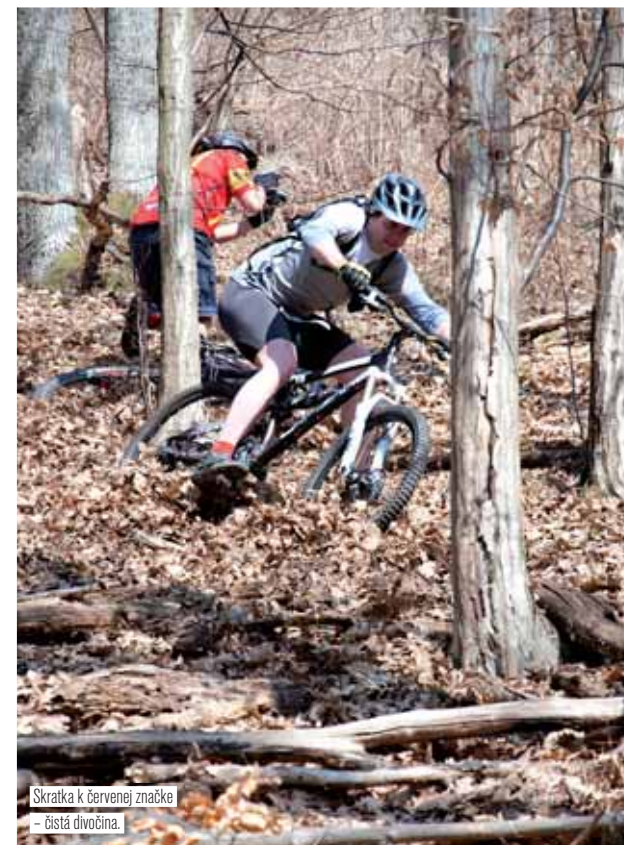
Skratka k červenej značke – čistá divočina.

Výhľad je parádny, v diaľke južným smerom vidno maďarský Csoványios. Ak sa pamätáte, pretrpeli sme ho pred dvoma rokmi. Čo je pre mňa oveľa lepšie, kričí po mne naozaj sexi zrzka! Postava, tvár a vek bez pripomienok, čo môže chcieť? Kýva o sto šesť a ja už začínam chápať, že to nebude pozvánka k niečomu, po čom túžia nielen ženy ☺. V jej ruke spoznávam žltú krabičku. Okamžite sa mi rozsvietilo, že je to naša GPS. Neváham a štartujem k nej, dokiaľ si to rozmyslí. Nemôžem uveriť, že na Slovensku mi niekto vrátil stratenú vec. Koktám a k ďakovačke