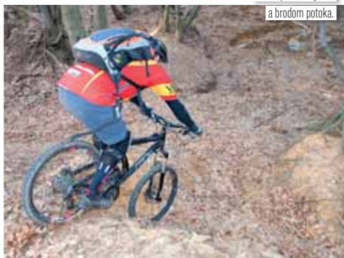
Tesne pred Dekýšom a brodom potoka.

kopa padnutého haluzia ako naschvál zanechaná pilčíkmi na chodníku. No, keďže sme „charakteri“ ako vystrihnutí z učebnice o slušnom správaní, zosadáme a všetko parádne odpraceme. Znova nasadáme a nenávratne sa blížíme k Vlčím jamám, kde sme včera začali stúpať na Sitno. Keď sa hovorí „ide to s tebou z kopca“ – väčšinou je to náznak, že nie je všetko v poriadku. To ale neplatí o bajkeroch, my taký stav práve potrebujeme!