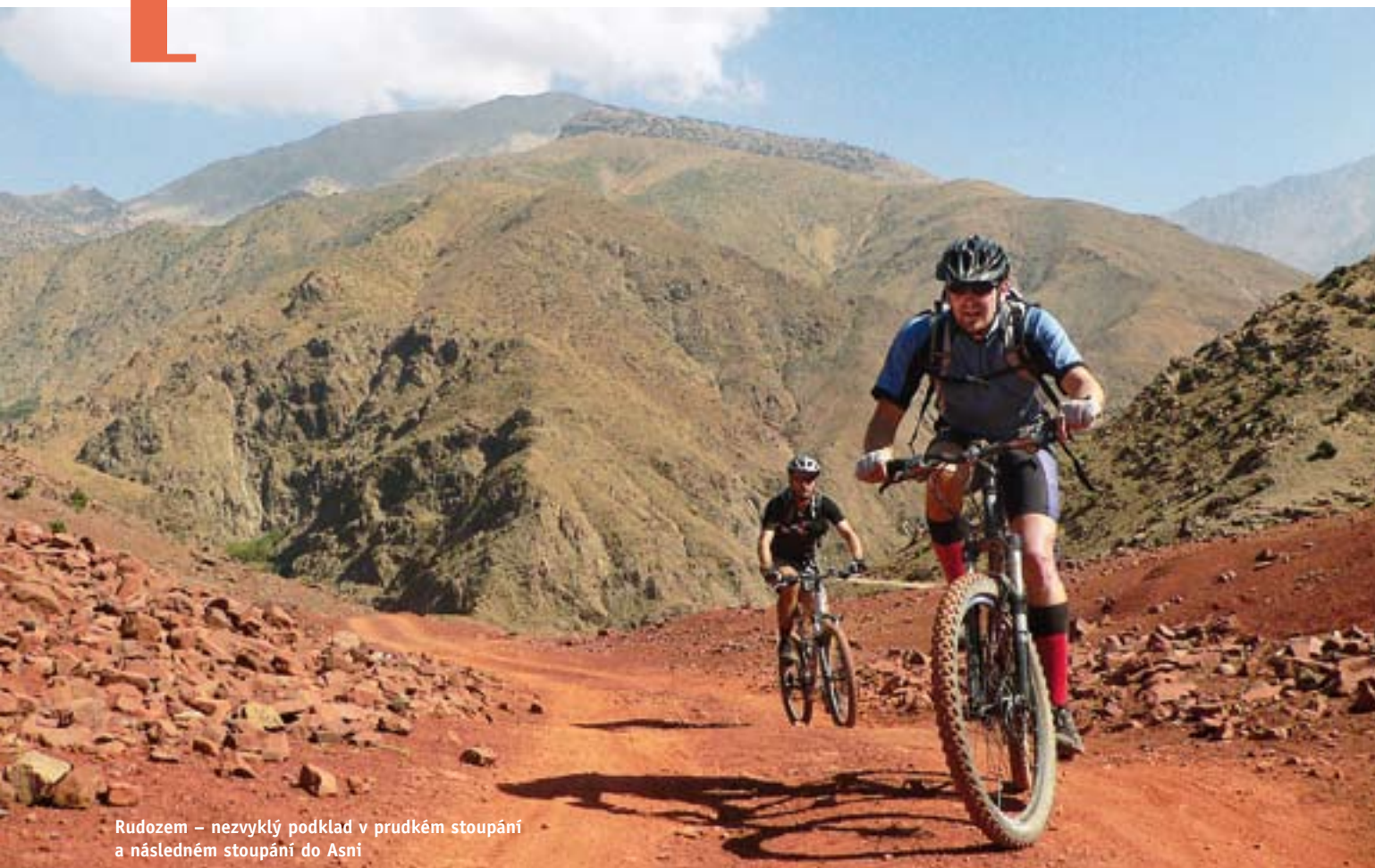
Rudozem – nezvyklý podklad v prudkém stoupání a následném stoupání do Asni