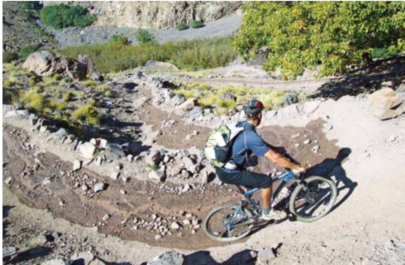
Šíkana nad údolím

Neznalí jízdy v terénu se možná diví, jak může být biker unavený cestou z kopce, ale jak vysvětlit někomu, že každý metr je boj? Vcelku jsem potěšený, když se napojíme na prašnou cestu. Na program dne přichází rychlost a drift do zatáček. To nejlepší odkrývá Atlas až nyní. Nic netušící jsme vhozeni na trail do vesničky Tinerhourine. Klikatý a prudký singl zapletený mezi hliněnými chatrčemi zpestřují kanálky na odvod vody a atmosféru koření překvapení Berbeři a jejich nás povzbuzující ratolestmi. Procitám do úplně jiného světa, až tunel pod domkem a klopinka ve stínu stromů ukončují nezvyklý zážitek. Jsme na spodku doliny a i kdyby