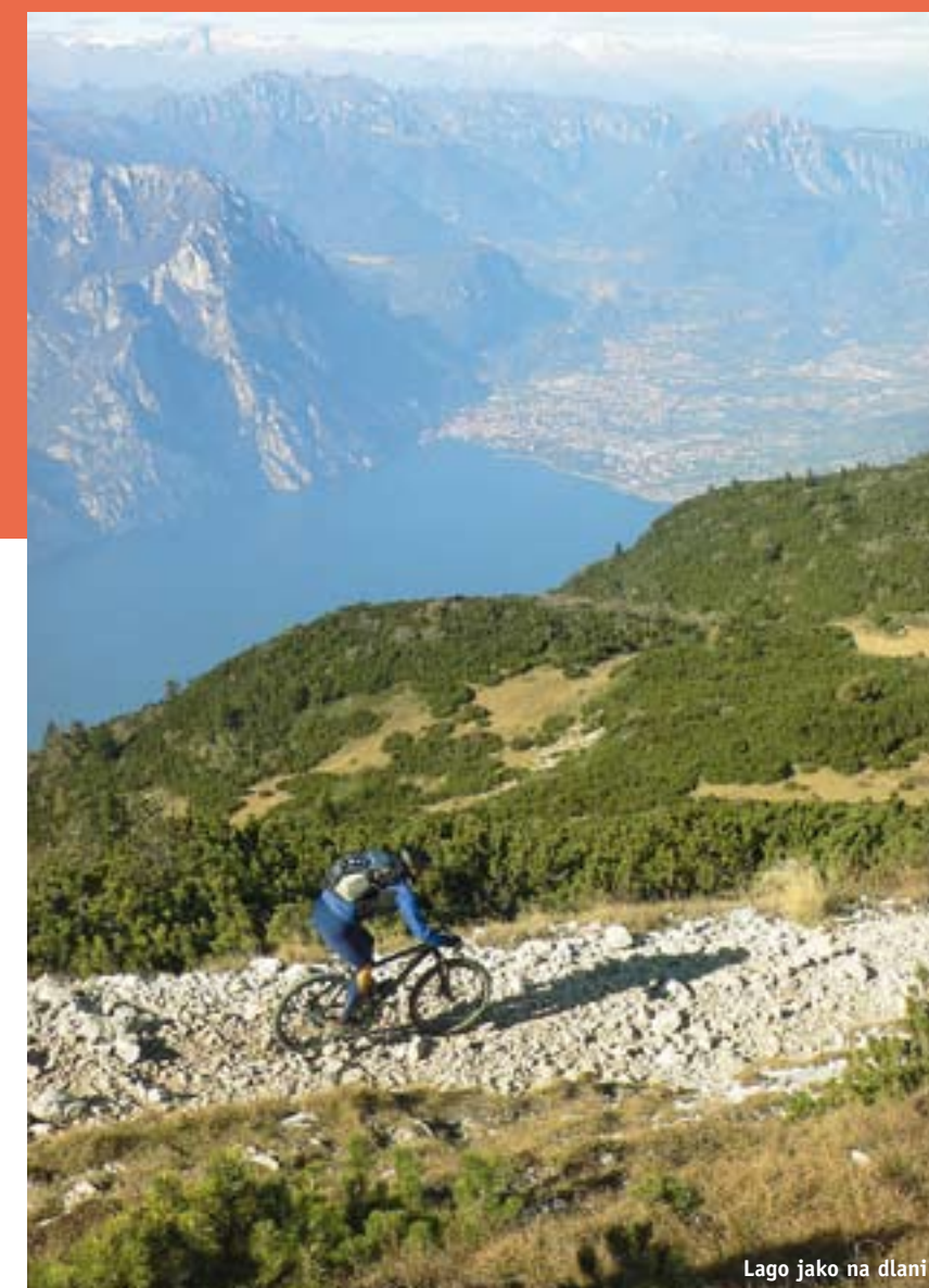
Lago jako na dlani

Naše první zastávka, jihošpanělské pohoří Sierra Nevada, mimochodem třetí nejvyšší v Evropě po Kavkazu a Alpách, je oblast bikům vcelku nezasvěcená, přitom úplně nezaslouženě. Vždyť kdo by nechtěl překročit hranici tři tisíc metrů v sedle anebo padat