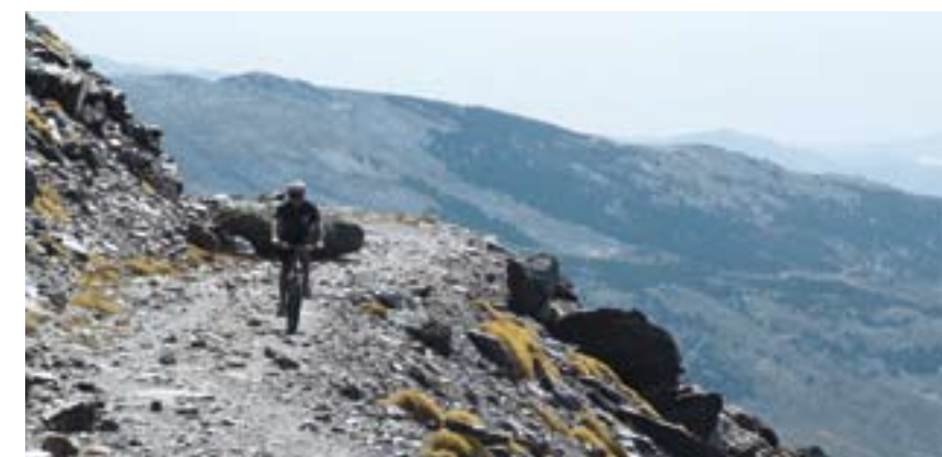
Těsně nad hranicí 3000 metrů se z široké šotolinové cesty stává řádná terénní dobrotá