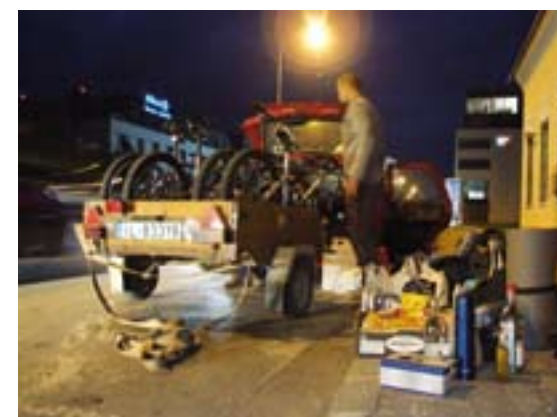
8000 km autem – výprava začíná